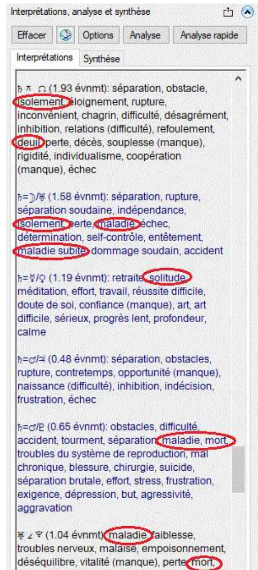
Figure 1 : Volet Interprétations

La figure 1 montre quelques contacts pour le thème du mercredi 8 avril 2020 à 6h pour Montréal. On y voit quelques mots clés significateurs de la pandémie, mais ils sont éparpillés; on peut facilement ne pas y prêter attention!